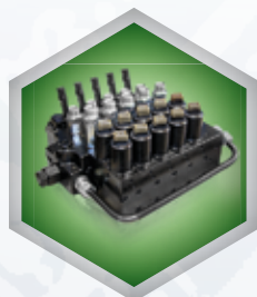
Distributore 5 Funzioni (1 funzione libera ma predisposta per argano) 5-function valve bank (1 function available, prearranged for winch)